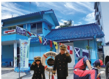
▲本物を体験してもらう職育活動

毎年3泊4日の船上体験や造船所の見学など、海の体験活動をしていましたが、コロナ禍で休止していました。春の再開に向けて船会社と現在準備中。久しぶりに船の旅を再開する計画です。