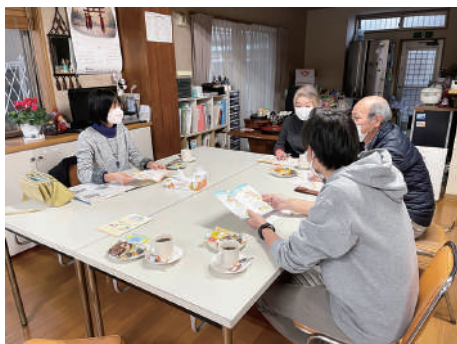
▲フードパントリー立ち上げ支援の様子