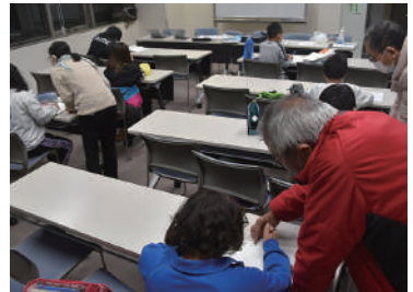
▲熱心に取り組む子供たち

すくすく勉強会の子供たちの中には、塾に通っている子もいれば、学校にも行けない子、様々な状況の子供たちがいます。どんな環境にあっても自主的に学習できるようにサポートし、子供自身の自己効力感が育つ場にしていきたいと願っています。