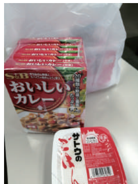
▲夏休みカレー大作戦県内30万食の支援

食堂と利用する子供の数はともに増加傾向にありますが、コロナ禍と長引く不況で、企業からの寄付の先細りも懸念されています。ネットワークでは県域からの支援だけでなく、コンパクトな市町村域で食堂を支える連携や協力関係づくりも支援しています。