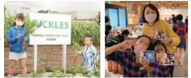
▲野菜収穫体験・オリジナルキムチづくり体験

株式会社ピクルスコーポレーションは、2021年から子ども食堂への寄付や食育活動、食品寄贈などの支援を行っております。食育活動では、ピクルスグループの施設やノウハウを活かして、野菜収穫体験とオリジナルキムチづくり体験をセットにした1日遠足企画を年に3回実施しています。