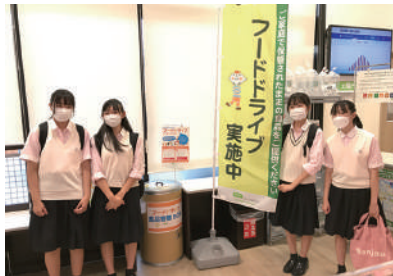
▲コープ久喜店でフードドライブ活動に取り組む久喜高校の生徒たち

2022年度は、コロナ禍で困難を強いられている世帯と、日本の米作り（米消費）を支援するために、「食べて 未来へつなごう 日本の米づくり応援キャンペーン」をテーマに、子ども食堂やフードパントリーなどへお米の提供を開始しました。県内各所にある事業所を活かし、支援団体が受け取りに来る負担を減らせるように、毎月複数の事業所で取り組んでいます。