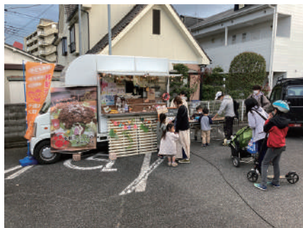
▲熊谷市市民活動支援センターにて

先頃、熊谷市の市民提案事業に移動式子ども食堂が採択されました。熊谷発の新たな子ども食堂として、各地に広めていきたいです。