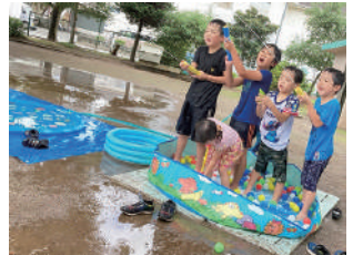
▲夏は盛大に水遊びをします！

プレーパークの動画を見て「自分もやりたい！」と情報を探中、県のこどもの居場所づくりアドバイザーの派遣事業を見つけました。プレーパークを運営するアドバイザーさんに思いを語り、助言をいただき、冒険遊び場いるぱーくを3回ほど見学し、5ヶ月後には、飯能市で初めてのプレーパークが開催できました。