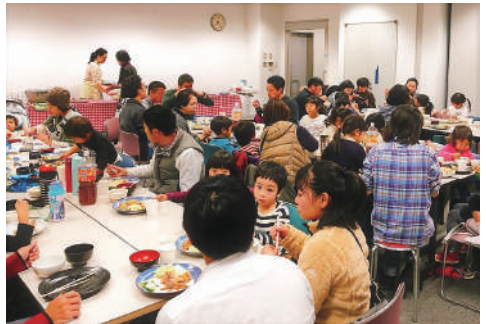
▲子ども食堂は地域のオアシス！