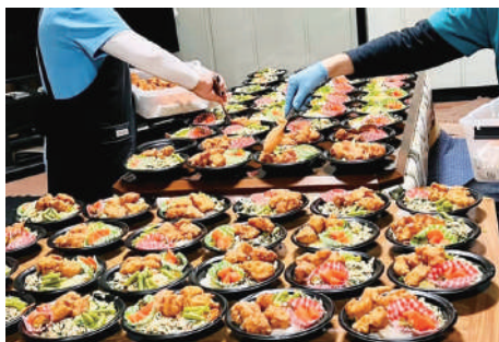
▲みんなで頑張ってます😊

子供たちの体験につながり、食育にも貢献できる子ども食堂を目指して、野菜選びや代金の受け渡しに子供たちが活躍しています。車いすユーザーですが、誰かの役に立ちたいという思いは同じです。心のこもった食が、必要な子供たちに届くよう、学校の近くに2・3軒の子ども食堂がある美里町が夢です。