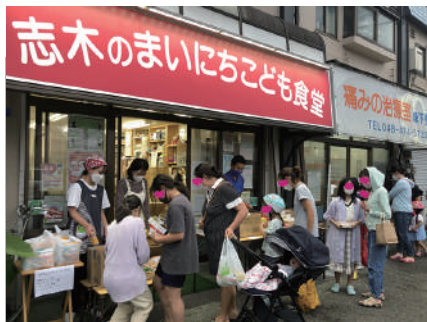
▲食品無料配付の様子

志木のまいにち子ども食堂はその名が示すとおり、毎日、いつでも、支え続けることを表明しています。コロナ禍で休校や閉店、人流が遮断された時期も、お弁当を作り続け、食品等を配付し、利用者問わずかでも繋がり、支援を止めることはありませんでした。困っているかこちらからは聞かない。でも、顔馴染みになると会話には、自然と子供のこと、家族のこと、日々の暮らしの困りごとが語られます。必要な支援の糸口は、毎日支え続けることで見えてきます。