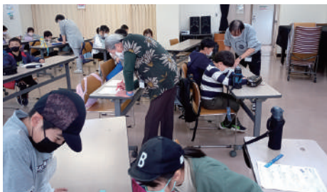
▲難しいプリントにチャレンジ

公民館職員の参加もあり、いざという時に必要な支援につないでくれます。子供の居場所が公民館にある意義は大きいのです。