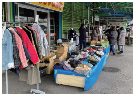
▲衣類や雑貨も配付しています