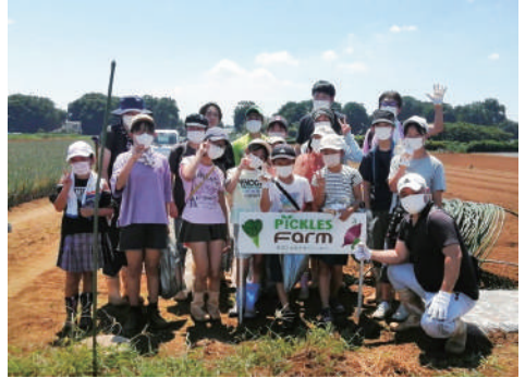
▲体験型支援（食農体験）も増えてきています

ネットワークでは、「多様化・拡充・スピードアップ・連携」と「さらに多くの方々と『子ども食堂』を考える場として『埼玉県子ども食堂ネットワーク』を成長させる」という目標を掲げています。県内の子ども食堂の水先案内人として、支援の窓口として、寄付食品の供給ラインとして、子ども食堂の未来を照らす埼玉県子ども食堂ネットワークには、県内のみならず全国からの期待と注目が集まっています。