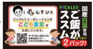
▲商品パッケージ側面掲載

また、より多くの方に子ども食堂について関心を持っていただくきっかけとなるように、一部商品パッケージの側面には子ども食堂を応援しているデザインを記載し、SNSやHPで情報発信を行っています。