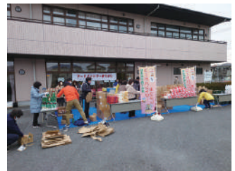
▲社協さんの施設でパントリー開催

今後は、登録家庭にアンケートなどで意見や要望を聞いて、利用しやすさも考えていきたいです。