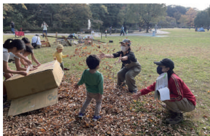
▲思いっきり落ち葉遊び

最近、県内で注目を集めているのが、プレーカーと呼ばれるモバイル(移動型)の活動です。ボックスカーに遊びの道具を詰め込み、あちこちの公園や森に出向いて、プレーパークを出前する活動で、プレーパークの開設に向けた助走の活動としても、効果が期待されています。