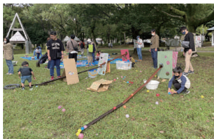
▲お父さんの参加がたくさん！