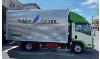
▲子供の居場所へ支援物資を運ぶトラック

SDGs（持続可能な開発目標）の達成に向けて物流会社という立場から、物流業界の将来のため、誰もが安心安全で暮らせる地域のため、人と環境の未来のために、社員一同になって取り組んでいます。