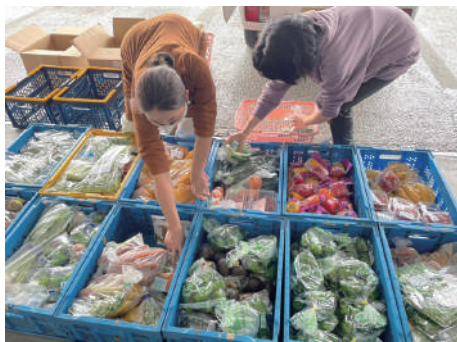
▲パルシステム埼玉さんからご寄付いただいた青果

越谷市では、フードパントリー・子ども食堂・プレーパーク・学習支援などの団体が集まり、子供サポートネットワークが立ち上がります。